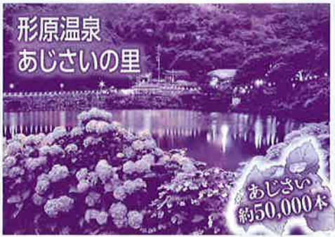
形原温泉 あじさいの里