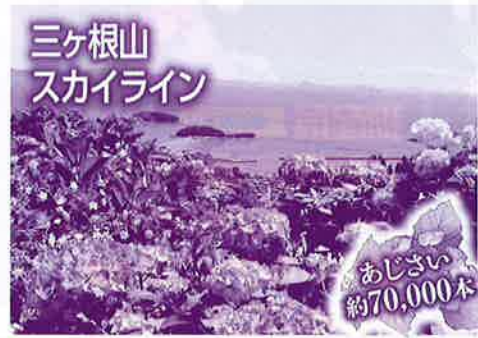
三ヶ根山 スカイライン