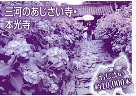
三河のあじさい寺・ 本光寺