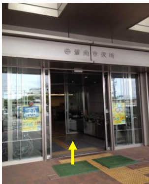
碧南市役所東側入口