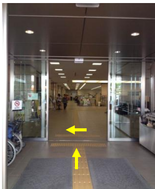
入口はいつでも左に