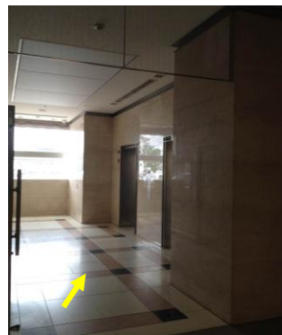
すぐにエレベーターホール2階へ